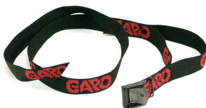
Spännband Art nr 79 101 35