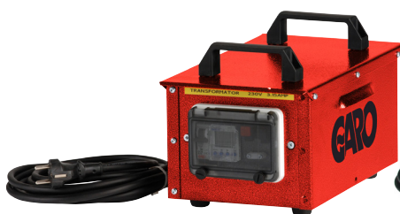
Trafo 1-grupp Art nr 52 081 44