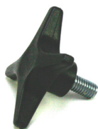
Rattskruv Art nr 10 71 03