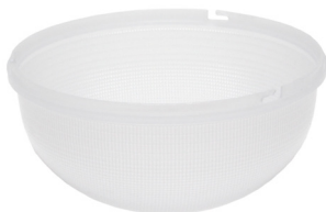
Kupa Art nr 79 060 59