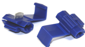
Kopplingsklämma 1,5-2,5 mm 2 Art nr 10 79 86