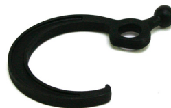
Upphängningskrok Art nr 79 040 68