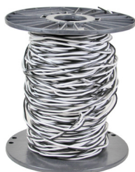
Installationsabel 2G2,5, tvinnad 10 79 99 100 m kabel 10 79 68 300 m kabel