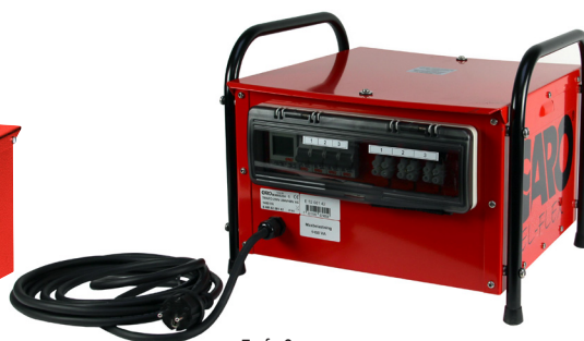
Trafo 3-grupp Art nr 52 081 42