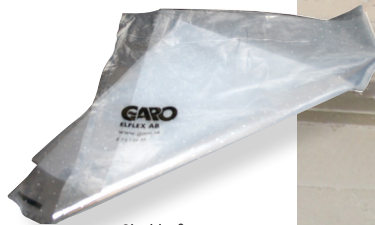
Skyddspåse Art nr 79 101 43