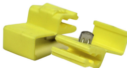
Kopplingsklämma 2,5-4 mm Art nr 10 79 28