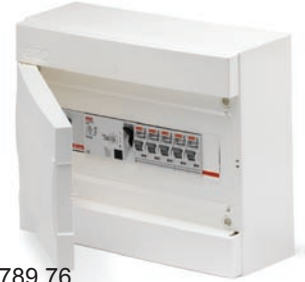
E21 789 76