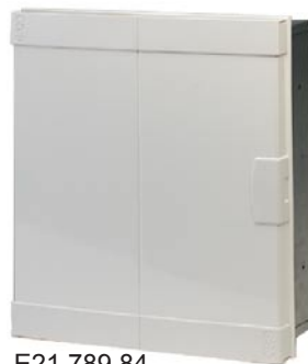
E21 789 84