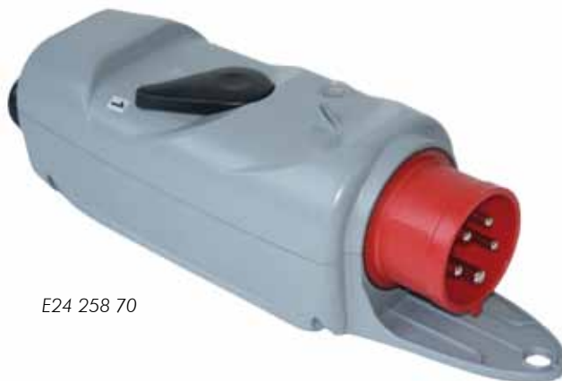
E24 258 70

Installbart motorskydd som skall monteras på skarvsladd. Spannet för inställning är mellan 10-16 A. Inklusive förskruvning 32 mm och för kabeldiameter 12-21 mm 2 . Vikt 0,919 kg Andra motorskydd på förfrågan.